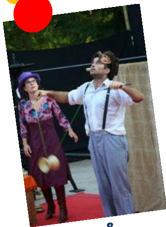
Jonglage & spectacle