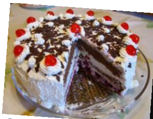
Cuisine et jeux de société