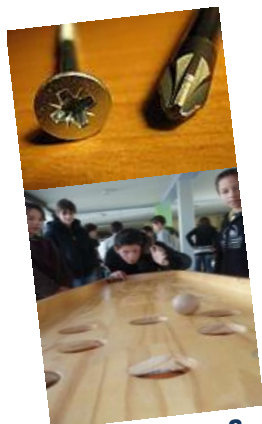
Bricolage & tournoi de jeux