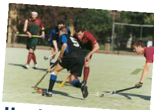
Handball & Hockey