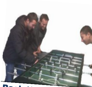
Raclette Party, ping pong et baby foot