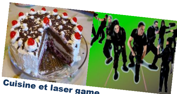
Cuisine et laser game