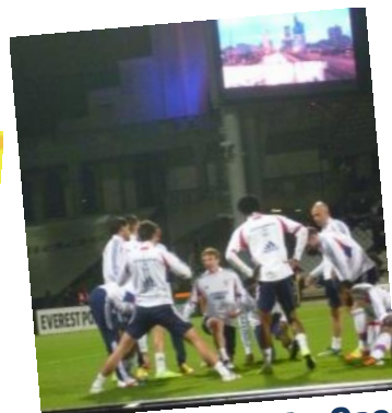
Sortie Match OL- Caen